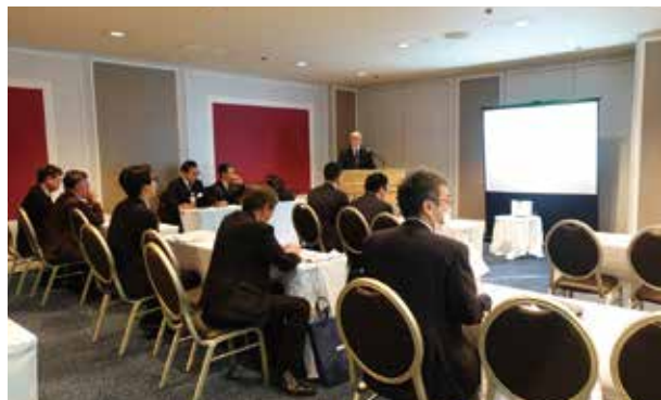
ミニセミナー「BaselⅢ最終化対応に関する情報交換会」NTTデータルウィーブ(株)